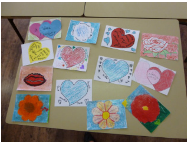
Le thème de l'édition 2015 a inspiré les élèves de CM2 de l'école Saint -Thomas en Haute-Garonne

Pour la première fois, des établissements organisent spontanément des concours internes et des expositions en marge de l'opération. Nous soutenons ces belles initiatives et espérons qu'elles se développeront à l'avenir.